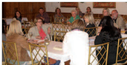
2. offenes Einzelhandelstreffen