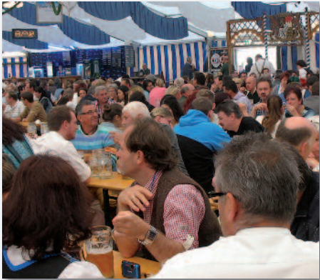
Das gut besuchte Festzelt