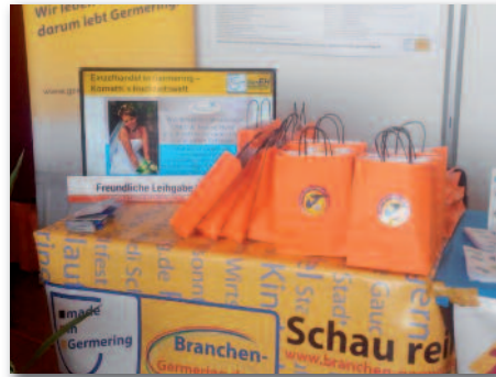
Stand des Gewerbeverbandes

Am Stand des Gewerbeverbandes wurden den zahlreichen Besuchern die teilnehmenden Geschäfte in einer Bildpräsentation vorgestellt. Außerdem erhielten alle Neubürgerinnen und Neubürger eine Geschenkbox mit kleinen Giveaways, Gutscheinen und Informationen über die Geschäfte, die sich an dieser neuen Werbeaktion beteiligt haben. N. Kornath