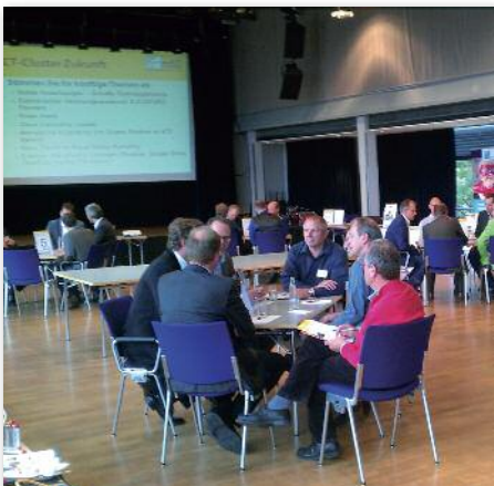
ICT-Businessbörse 2014 - Open Café

Heuer erweitern wir den Kreis der Eingeladenen auf alle IT-Unternehmen aus der Region um Germering herum, um so noch eine größere Vernetzung und Zusammenarbeit von Gleichgesinnten zu erreichen! Weitere Informationen und das Anmeldeformular finden Sie unter www.gewerbeverband-germering.de